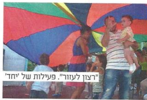
"רצון לעזור". פעילות של 'יחד'

לתרומות ניתן לפנות למספר הטלפון 1-800-800-543 או באתר האינטרנט http://www.yachad.org.il